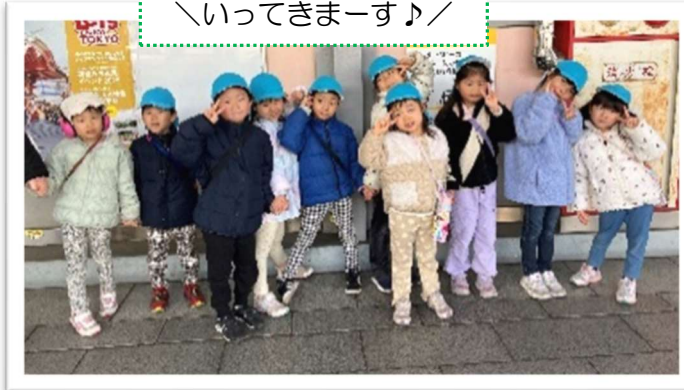
＼そろそろ電車くるかな？／