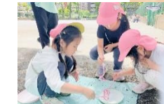
シャボン玉液、ハートや星型の道具を手作りして、いざ公園へ！わーい♪