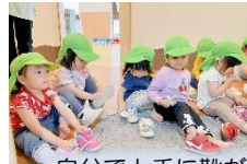
自分で上手に靴が履けるようになりました。おさんぽへGO!