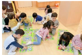
幼児の保育室にあるおもちゃに夢中