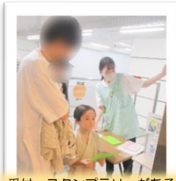
受付 スタンプラリーがあるよ