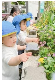
ふきながしを持って