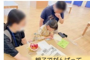
親子でがんばって くるくるしゃぼん玉を 作っています♪