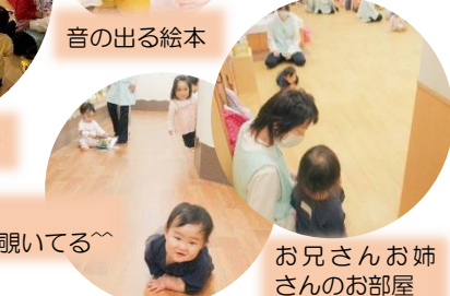
お兄さんお姉さんのお部屋