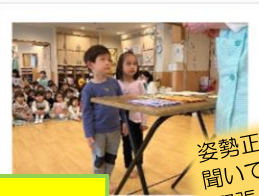
姿勢正しく園長先生のお話を聞いています (緊張してるのかな?)