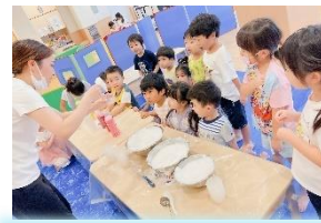
石鹸の泡をクリームに見立てて、フルーツシロップに見立てた色水をかけて、いい香りに包まれてました♪