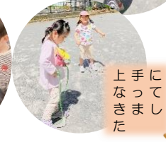
上手に なきました