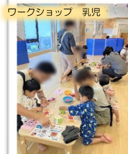
ワークショップ 乳児