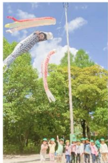
おやつを持って散歩