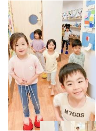
ぼっくり上手でしょ♪