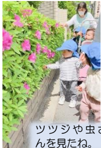
ツツジや虫さんを見たね。