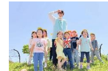
芝滑り 始めは躊躇してたけど、楽しいことが分かり、皆キャラクター滑りました☆ 「あっ、船だ!!」