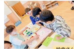
給食さんの野菜スタンプ みんなでペタペタしたスタンプ画が、色 とりどりの花火となりました。