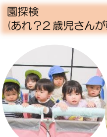
園探検 (あれ?2歳児さんが覗いてる^^)