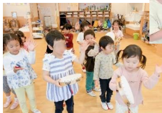
いろんな楽器を知る☆