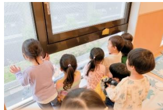
窓掃除のおじさんだあ♪ ワイパーが右左 お顔も右左