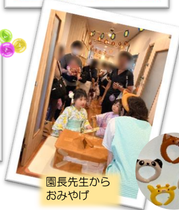
園長先生から おみやげ