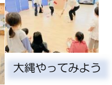
大縄やってみよう