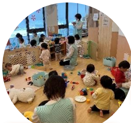
保育園のおもちゃ♪