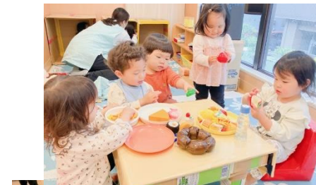
先生の手作りテーブルやイス等でおままごと