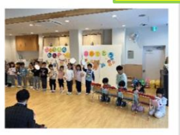
1歳児さん たくさんの初めて