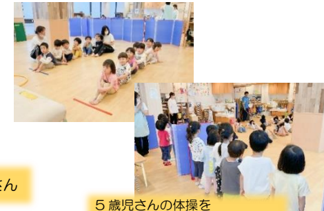
5 歳児さんの体操を 憧れの眼差しで見る 3 歳児さん