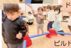
ビルドインバランス♪