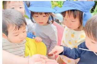
「だんごむしー」 ツンツン丸まったねえ