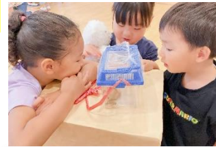
「てんとう虫の赤ちゃんじゃない？」 「育ててみよう」