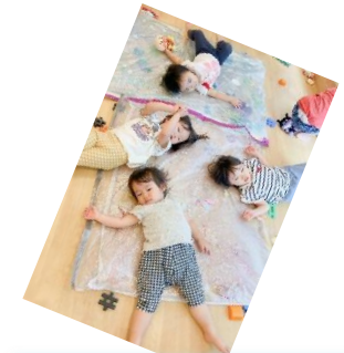
センサーマットの上にゴロ〜ン