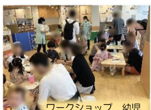
ワークショップ 幼児