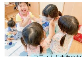
スライムを先生のお顔に〜