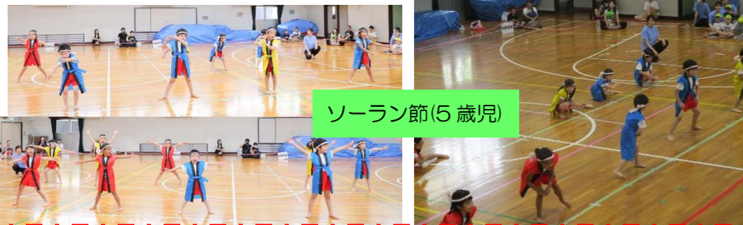
5歳児さんのかわいいソーラン節、続いて、年長さんの挨拶で運動会を締めくくりました。