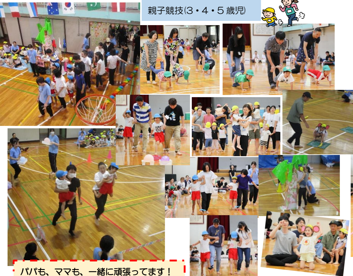
パパも、ママも、一緒に頑張ってます!