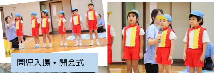
園児入場・開会式