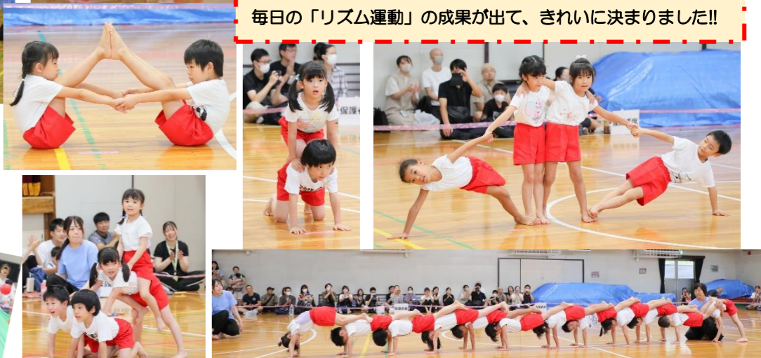
みんなで力を合わせて「一本橋」大成功☆☆☆