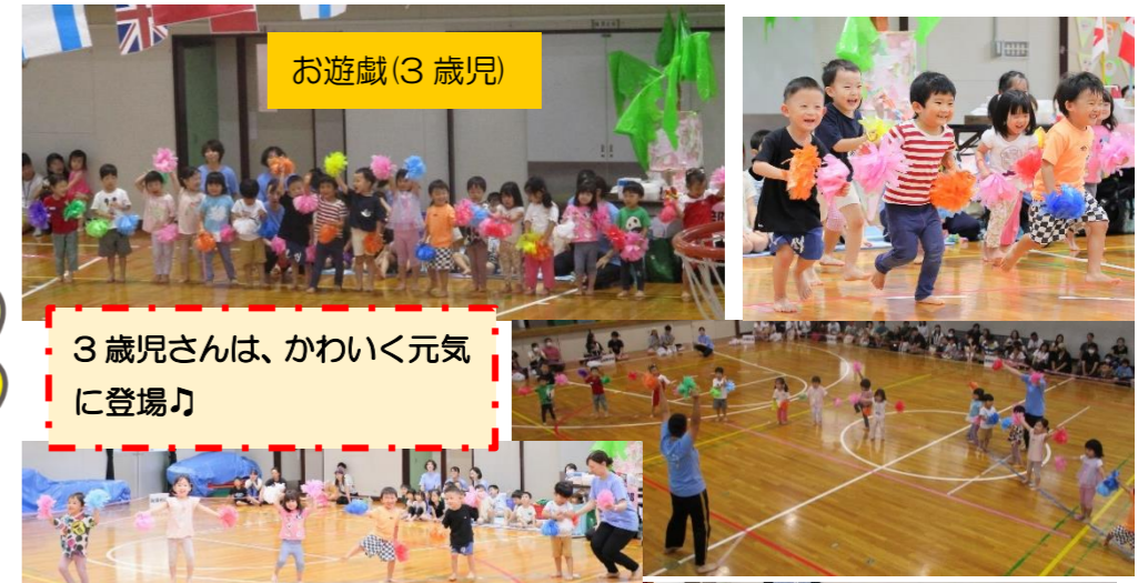
3歳児さんは、かわいく元気に登場♪