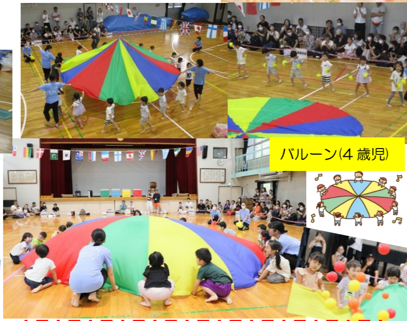
みんなの息を合わせて様々な形を作ります。上手にできたねー♪