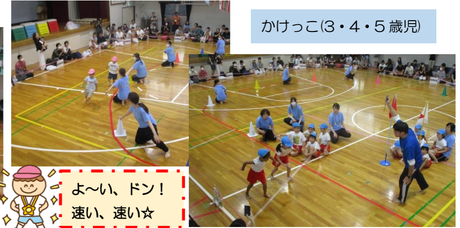
かけっこ(3・4・5歳児)