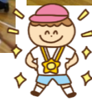
よーい、ドン! 速い、速い☆