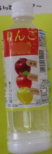
りんごじゅーす 1ぼん 42ぐらむ