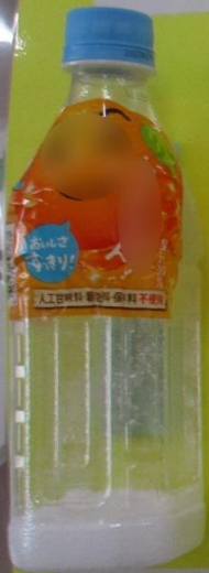
おれんじじゅーす 1ぼん 46ぐらむ