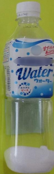
かるびす 1ぼん 54ぐらむ